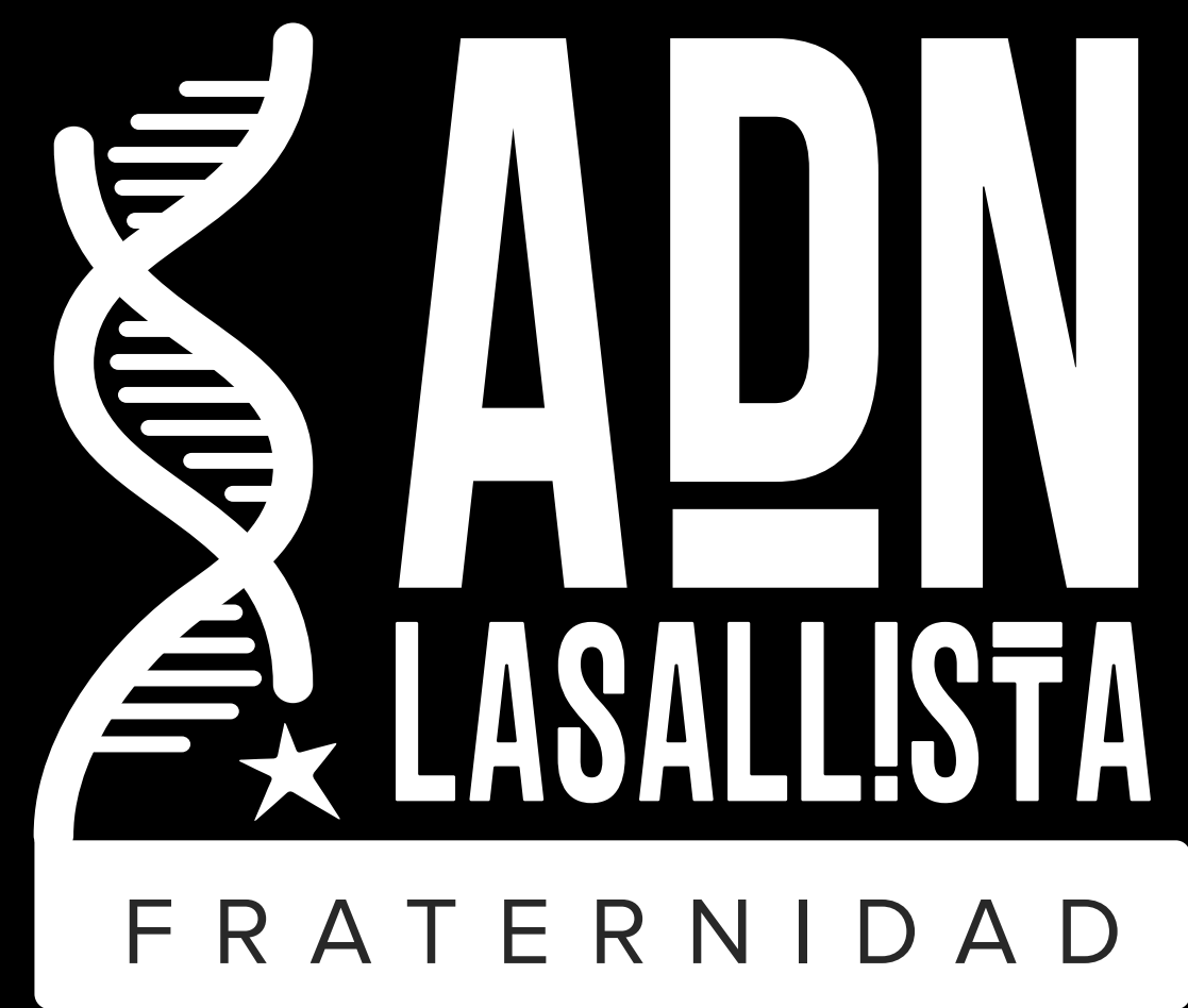
Logo negativo en blanco