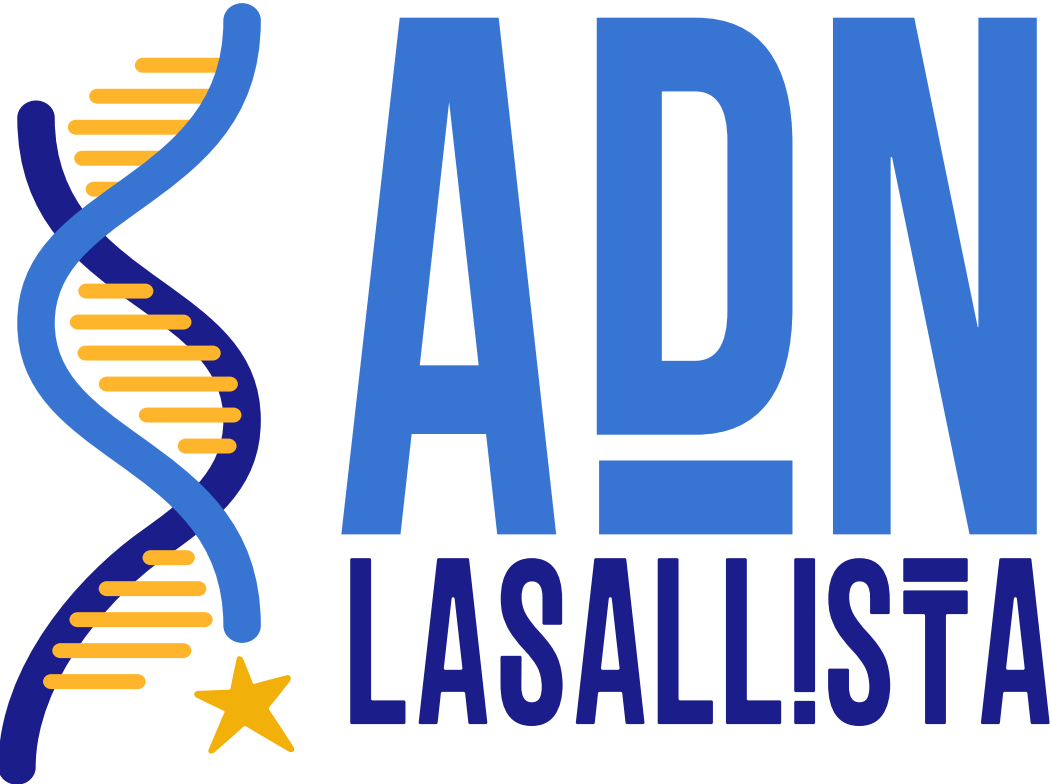
a. Logo básico